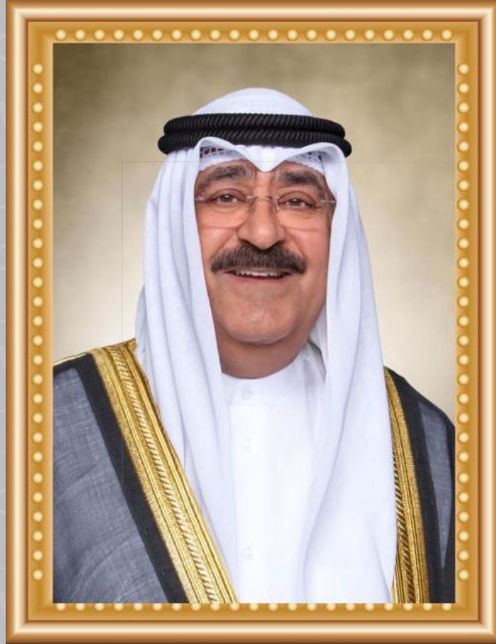
صاحب السمو الشيخ مشعل الأحمد الجابر الصباح أمير دولة الكويت